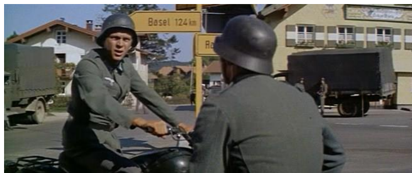
Steve McQueen in Weißbach vor Gasthof Wörle