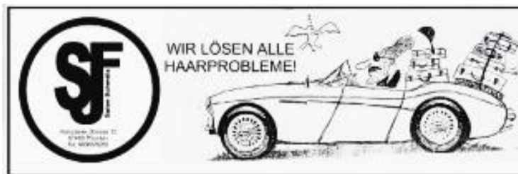
Salon Jacob Schmölz