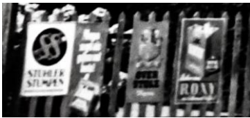
Reklame am Zaun