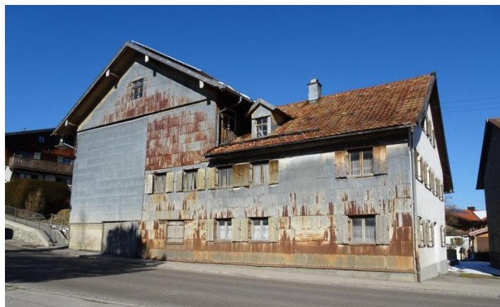
2. Standort: Weißbach, Füssener Str. 7