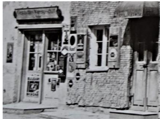
Reklame BULGARI - KRONE