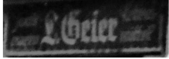
L. Geier -Lebensmittel