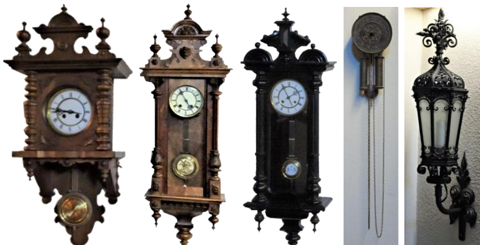
eine Laterne noch aus König Ludwigs II Zeiten

1. Standort: Weißbach 61, Kemptener Str. 20, „Unterer Luiser“